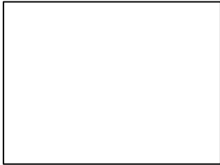
بچہ / لڑکی کے لیے / لڑکی کے لیے / لڑکی کے لیے